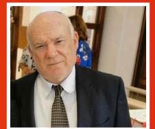
Shraya KAV Prim Rabin al Oradei