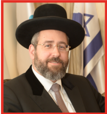
Șef Rabin David LAU Șef Rabin Ashkenaz al Statului Israel

UNIVERSITATEA COMUNITĂȚII EVREIEȘTI EUROPENE